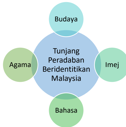
Rajah: Tunjang Peradaban Beridentitikan Malaysia.

Peradaban beridentitikan Malaysia mestilah suatu peradaban yang mempunyai identiti kukuh sebagai seorang anggota masyarakat Malaysia yang bertunjangan budaya, imej, bahasa dan agama sebagai landasan utama dalam menjalani kehidupan mereka.