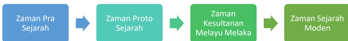
Rajah: Fasa-Fasa Perkembangan Sejarah Alam Melayu

Selanjutnya ialah fasa zaman sejarah moden di mana tanah Melayu menuju ke arah kemerdekaan. Pada waktu ini juga, kerajaan berusaha untuk mengukuh perpaduan dan penyatuan kaum yang terdiri daripada pelbagai latar belakang bangsa dan agama. Di samping itu, pembinaan negara bangsa Malaysia turut dirancang bagi memacu negara ke arah yang lebih cemerlang.