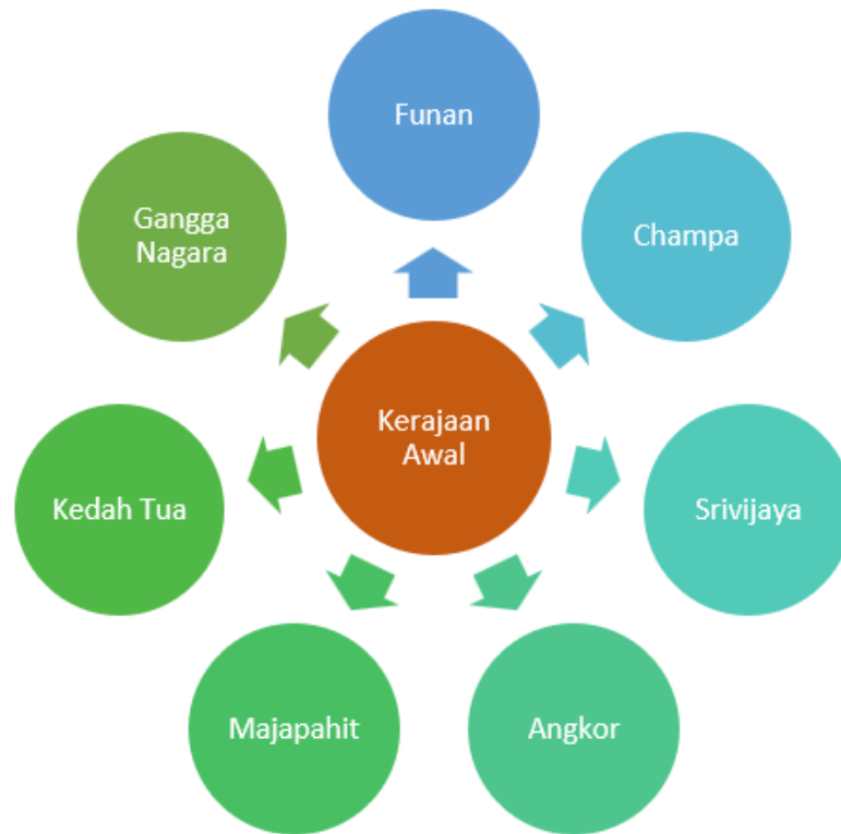
Rajah: Kerajaan-kerajaan awal.

Kemasyuran Champa bermula di bawah pemerintahan Che Bong Nga. Kemerosotan kerajaan Champa bermula apabila pemerintahnya, Indravarman meninggal dunia pada tahun 1441. Champa berjaya ditawan oleh Dai Viet pada tahun 1471.